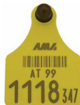
Musterohrmarke für Rinder

Die Kennzeichnung muss innerhalb von sieben Tagen nach der Geburt eines Kalbes erfolgen. Die Kennzeichnung von Kälbern, die in Freilandhaltung gehalten werden, hat innerhalb von 20 Tagen nach deren Geburt zu erfolgen. Verbringungen sind nur mit ordnungsgemäßer Kennzeichnung zulässig.