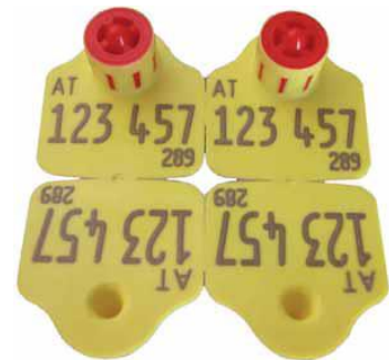
Musterohrmarke für Schafe und Ziegen

Sämtliche Kennzeichen müssen den ISO-Ländercode ("AT" für Österreich) und einen individuellen Code (Einzeltierkennzeichnung) aus 9 Ziffern enthalten.