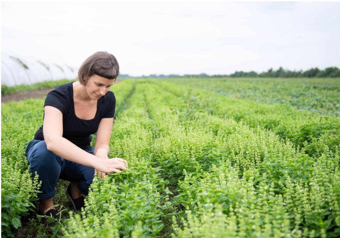
(Glashausgemüse, Paul Gruber, BML)

Fördermaßnahme „Förderung von Operationellen Gruppen und von Innovationsprojekten im Rahmen der Europäischen Innovationspartnerschaft für landwirtschaftliche Produktivität und Nachhaltigkeit – EIP-AGRI, 2. Phase“ (77-06) des GAP-Strategieplan Österreich 2023–2027