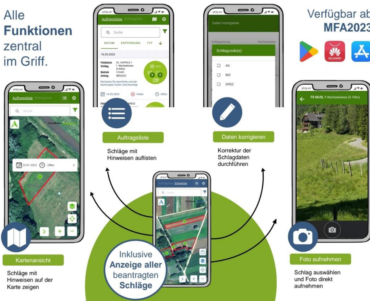
Abbildung 2: Auszug aus der Kurzanleitung der „AMA MFA Fotos“ App