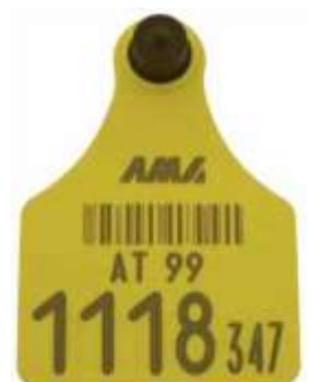
Musterohrmarke für Rinder

Die Kennzeichnung muss innerhalb von sieben Tagen nach der Geburt eines Kalbes erfolgen. Die Kennzeichnung von Kälbern, die in Freilandhaltung gehalten werden, hat innerhalb von 20 Tagen nach deren Geburt zu erfolgen. Verbringungen sind nur mit ordnungsgemäßer Kennzeichnung zulässig.