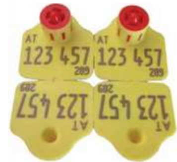
Musterohrmarke für Schafe und Ziegen

Sämtliche Kennzeichen müssen den ISO-Ländercode ("AT" für Österreich) und einen individuellen Code (Einzeltierkennzeichnung) aus 9 Ziffern enthalten.