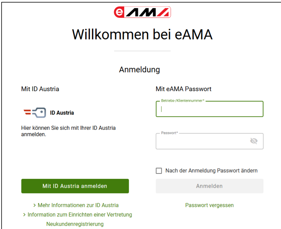
Abbildung 2: eAMA Login

Sollten beim Einstieg oder bei der Benützung von eAMA Probleme auftreten, können Sie sich gerne telefonisch unter 050 3151 99 bzw. per Mail an einstiegshilfe@ama.gv.at an die AMA wenden.