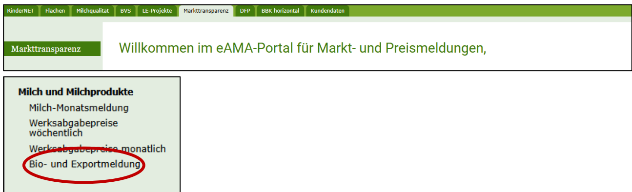
Abbildung 4: Benutzeroberfläche Bio- und Exportmeldung - Startseite - grün hinterlegte Box

In eAMA unter der Registerkarte „Markttransparenz“, werden Ihnen links in der grün hinterlegten Box, die für Sie zugewiesenen Meldungen angezeigt. Durch das Anklicken von „Bio- und Exportmeldung“ erscheint die dazugehörige Erfassungsmaske.