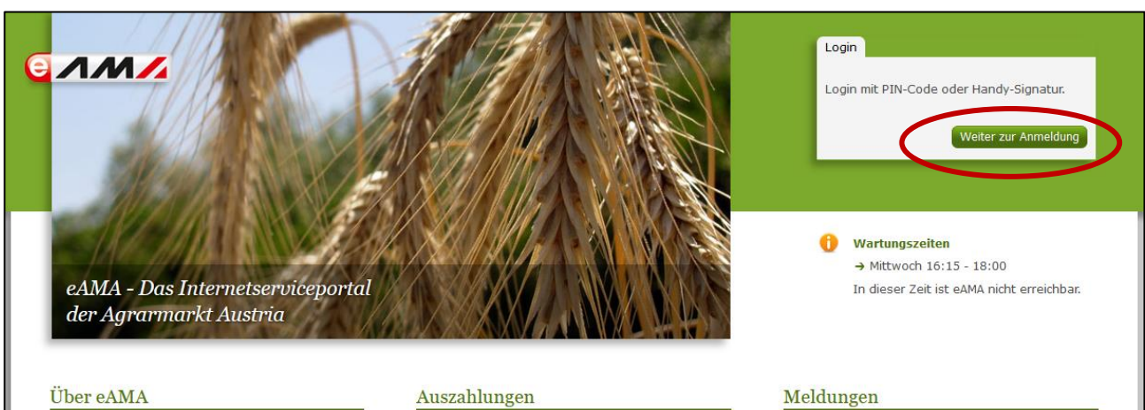
Abbildung 1: eAMA Startseite

Um die Meldung so effizient und einfach wie möglich zu gestalten, erfolgt die Datenübermittlung auf elektronischem Weg über das Internet mittels dem Serviceportal eAMA ( www.eama.at ). Die Anmeldung im eAMA wird entweder durch die Betriebs- bzw. Klientennummer und dem PIN-Code oder mit der Handy-Signatur durchgeführt.