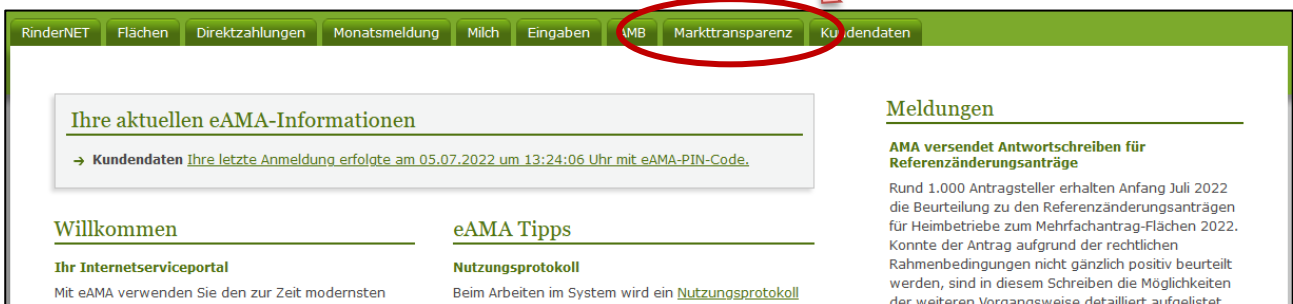
Abbildung 3: Registerkarte Markttransparenz

Nach erfolgreichem Login kann in der Registerkarte „ Markttransparenz “ die jeweilige Erfassungsmaske aufgerufen und die Meldung eingegeben werden.